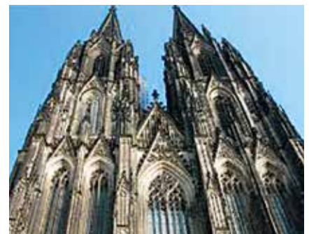
Genialitet satt i system. Tallet 153 hogd ut i stein. Kölnerdomen i Tyskland er kristenhetens viktigste signalbygg.