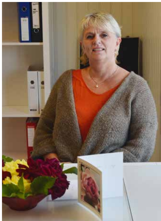
Marna på plass i kontoret sitt på Kjerkstu.