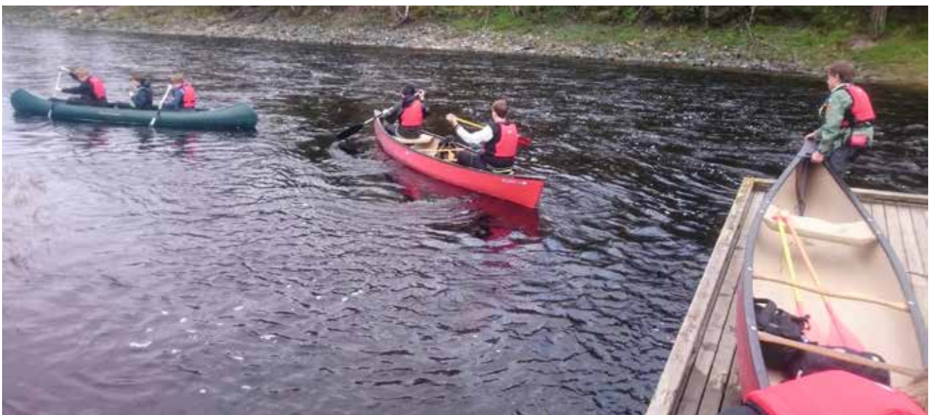
Speiderne gjør mye artig. Her er de ute og padler med kano.

- Noen få er passive medlemmer fordi de er utflyttet, men de