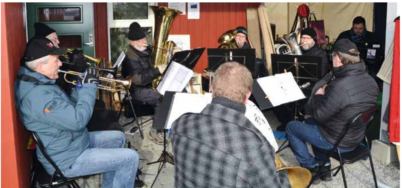
Røra-oktetten stiller alltid opp!