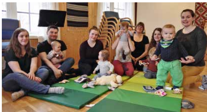
Trilletreff med hele 6 barn pluss foreldre – kjempegøy!

Ca. hver tredje mandag har vi Trilletreff for foreldre i fødselspermisjon. Vi starter med en trilletur fra Sakshaug kirke kl. 11.00 og avslutter med lunsj på lillesalen. Dette er en fin måte å bli kjent med andre foreldre og barn, i tillegg til litt trim. Første gang etter sommeren blir mandag 27. august kl. 11.00. Håper vi ser mange nye fjes i tillegg til gamle!