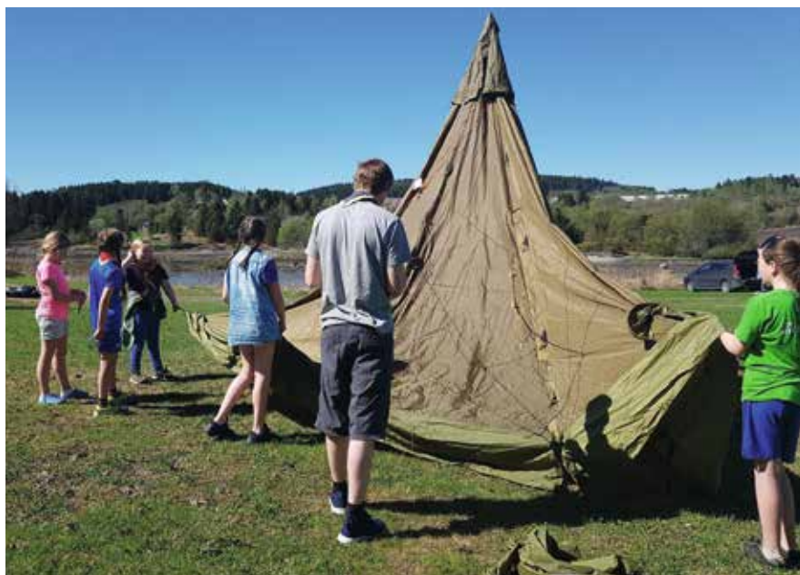
Her rigges det teltleir på Hjulstadholmen.

- De yngste tar merker, og det kan være i alt fra dyrelivet i fjæra til fakta om blomster. I skogen kan man ta bål- og matmerker, eller i pionering. Da lager vi portaler der vi surrer rager med sisaltau, eller vi byg-