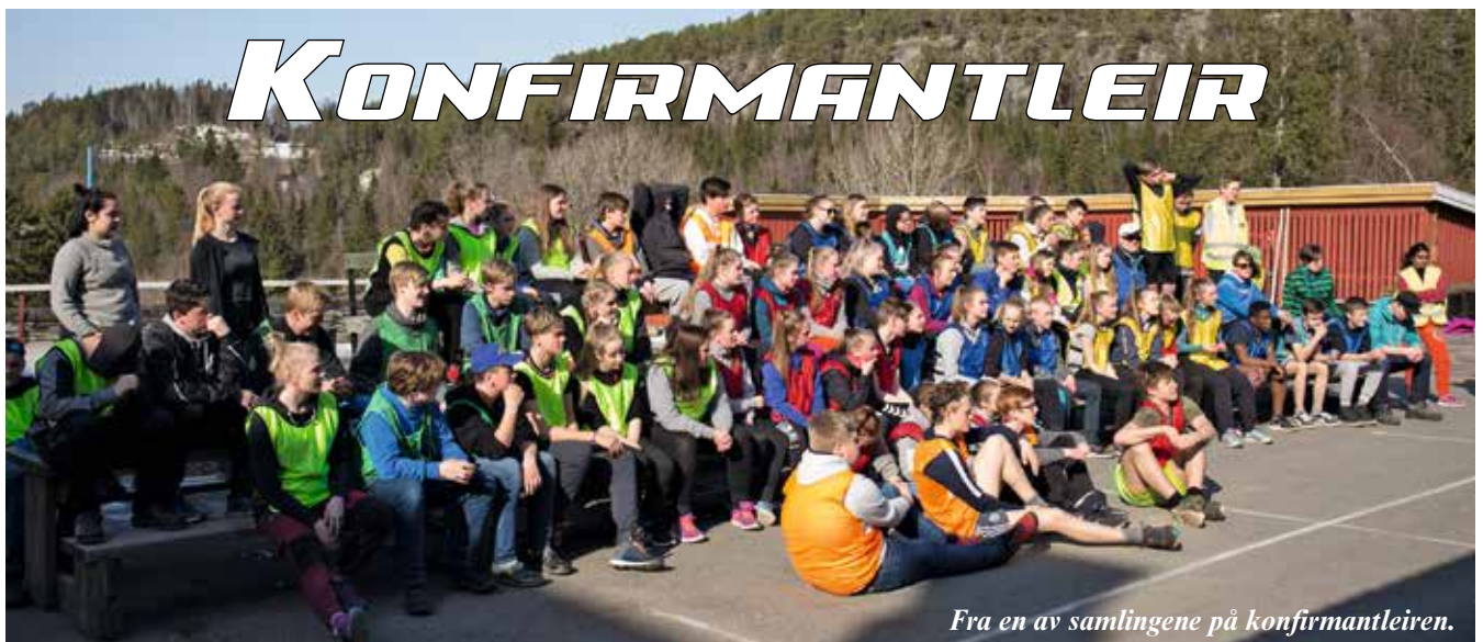
Fra en av samlingene på konfirmantleiren.

I april var det leir for alle konfirmantene våre i Inderøy på Solhaug leirsted i Åsen. 75 konfirmanter og 20 ledere var sammen fredag ettermiddag til søndag ettermiddag. Vi spiste sammen, hadde uteaktiviteter, undervisning, kveldsunderholdning, kveldssamlinger med lyskors, gudstjeneste, gode samtaler med mer. Masse liv og glede med flotte konfirmanter. Det hadde vært umulig å arrangere en slik leir uten de 15 tidligere konfirmantene som var med som ungdomsledere på leiren. De var gruppeledere og bidro ellers