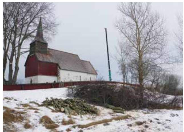
Kirka har på nytt blitt et viktig element i landskapet.