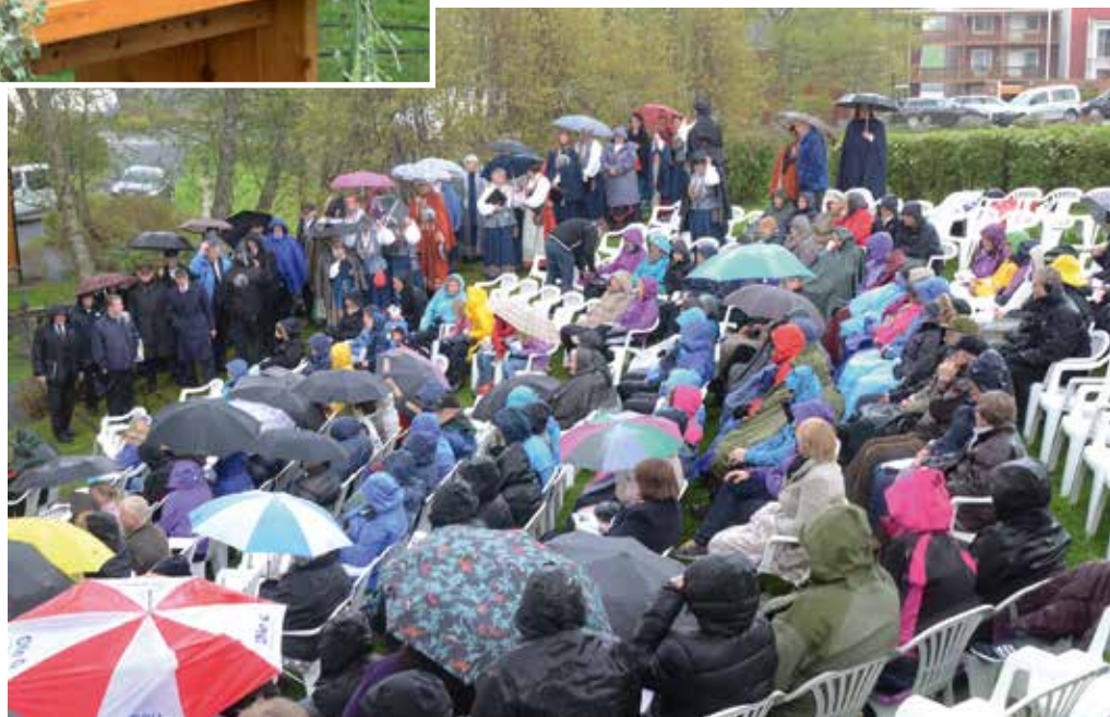
NRK gjør opptak av pinsegudstjeneste i Muustrøparken 20. mai.