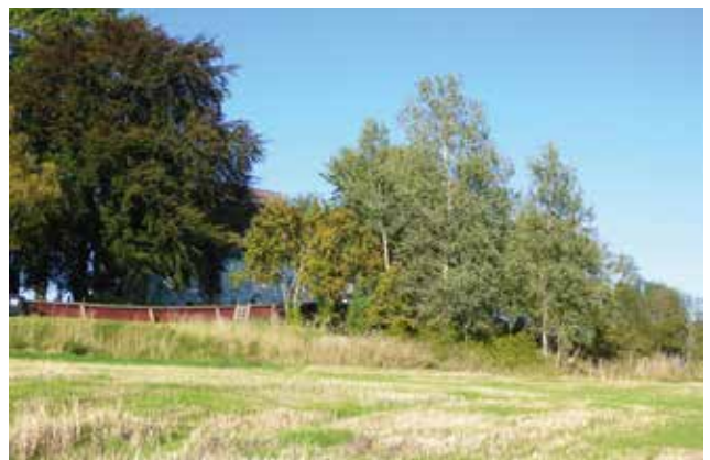
Kirka var skjult av trær og buskas.