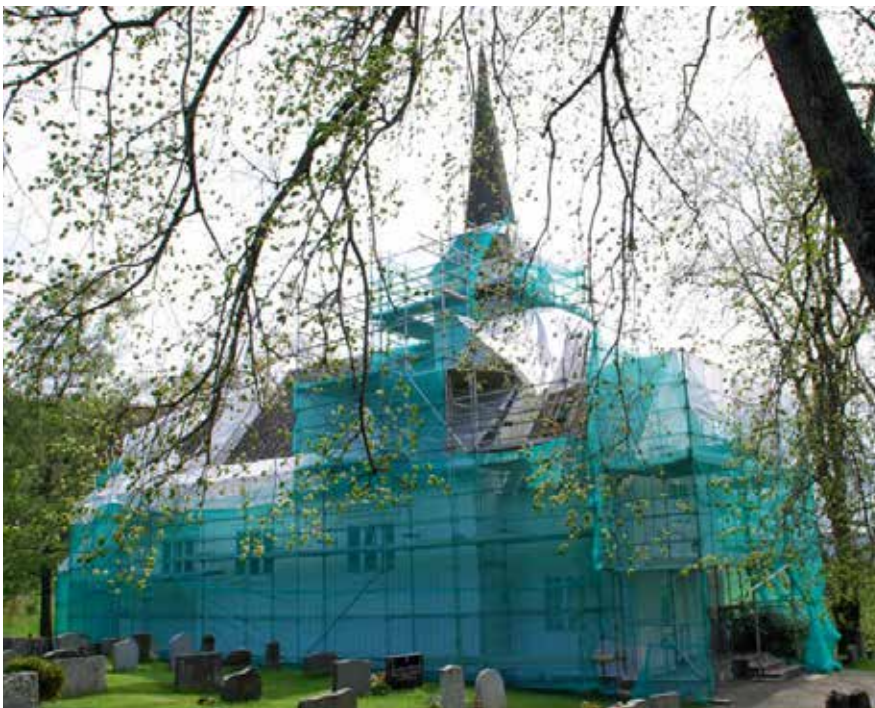
Salberg kyrkje blir sett i stand til jubileum.

Nemnda fann fort ut at det ikkje hyrer med tre hundre år når det skal skrivast om dette. Vi veit sikkert at det sto ei kyrkje her i 1432, for snart 600 år sia. Men det stoppar ikkje der. Som lesarane vil sjå, er det alt som taler for at den første kyrkja her vart reist seint på 1100-talet eller om kring 1200. Vi meiner til og med at vi har eit bevis for det som kan stå seg godt. Det er likevel lite å finne av spesifikke opplysningar om nettopp vår kyrkje frå dei tid-