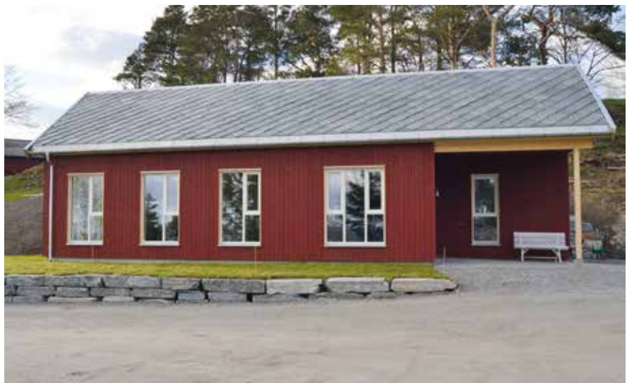
Salbergstu – slik den framstod høsten 2015.