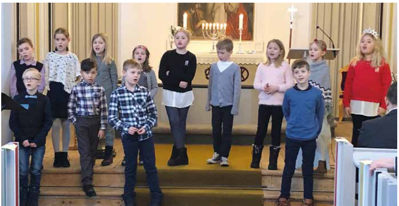
Det var fine og trivelige innslag av elevene i 3. klasse. De var godt forberedt – både når det gjaldt oppstilling, sang og dans.