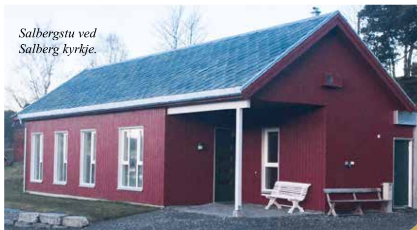
Salbergstu ved Salberg kyrkje.

Det er også behov for frivillige i Salbergstuas Venner!