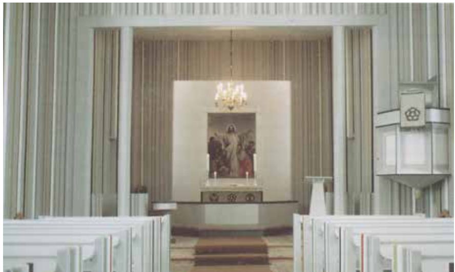
Frå Heggstad kyrkje.