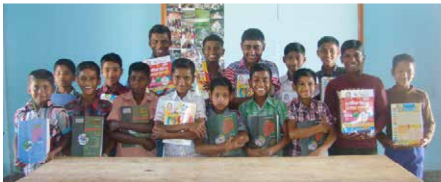
Utdeling av skolebøker.