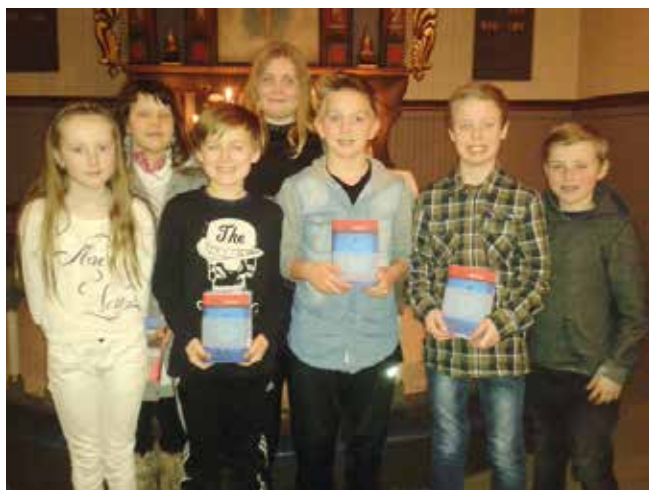
Utdeling av bibler i Vestvik kirke.

KodeB-samlingen er en del av kirkens trosopplæringsplan her i Inderøy. På 3. trinn blir barna invitert til Tårnagentdag, og til høsten vil de som nå fikk bibler, bli invitert til LysVåken i kirka. Da blir det overnatting i kirka, og mye gøy. Selv om vi er i startgropa med disse tilbudene i vår kommune, så opplever vi at barna melder seg på de ulike arrangementene, og at det ryktes at det er moro å være med.