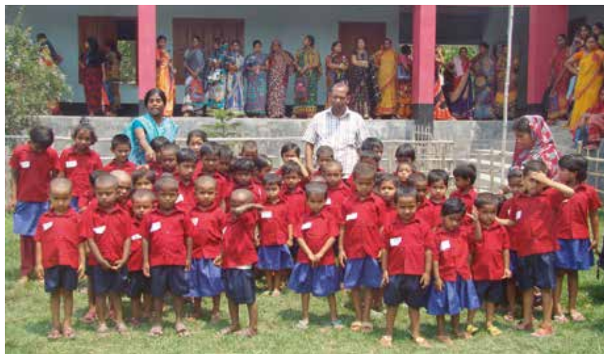
Førskolebarn, lærere og foreldre.