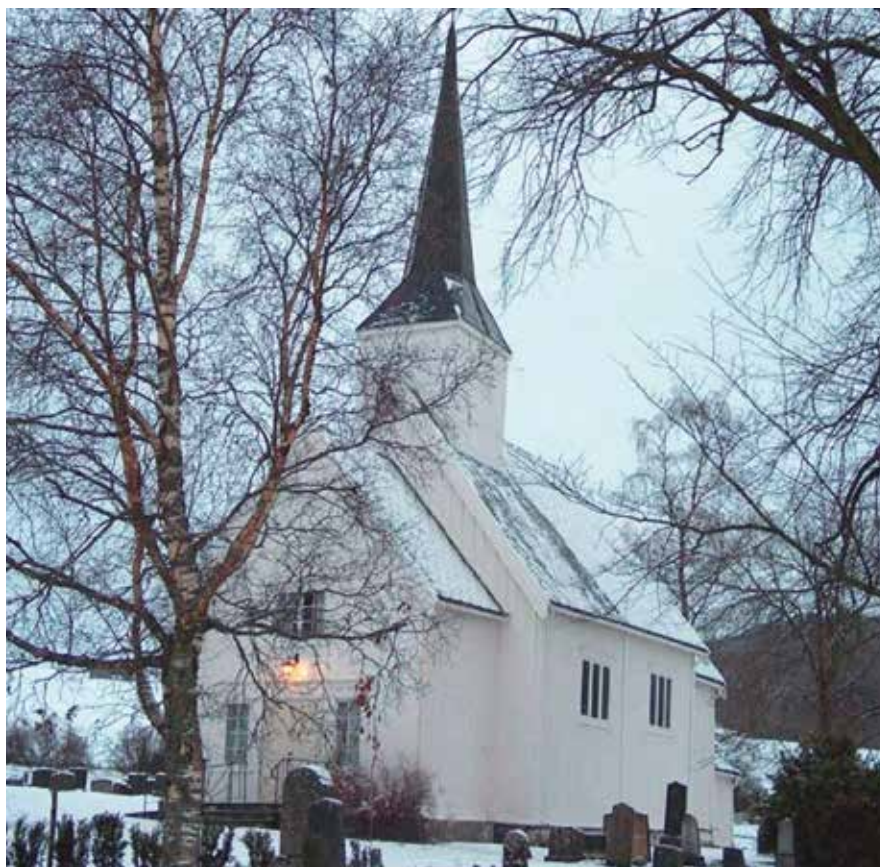
Salberg kyrkje i vinterskrud.