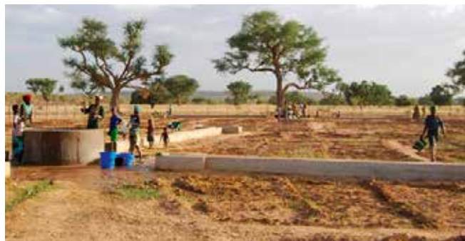
Nyanlagt grønnsakhage i Sare Hamadi. Vanningskanalene gjør det lettere for kvinnene å føre vann til åkrene.