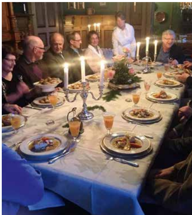
Ved middagen på Vinje.

Som skogbruker må jeg tillate meg også å ta med følgende: Vinje, og noen få andre store skogeiendommer i Nord-Trøndelag og rundt Oslofjorden, vokste fram på 16- og 17-hundretallet som en følge av den store etterspørselen internasjonalt etter trelast. Høy virkeskvalitet, nærhet til havet og sjøfartstradisjoner gjorde skogen i Norge meget attraktiv, og det var på 17-hundretallet disse skoggodsene hadde sin storhetstid. Disse skogeiendommene var hovedleverandøren til de mange sagbrukene som stod ved vassdragene. Denne industrien var såpass stor i vårt land på denne tida at Norge på