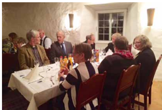
Frivillige og ansatte hygger seg i restauranten Hjorten på Gjørv.