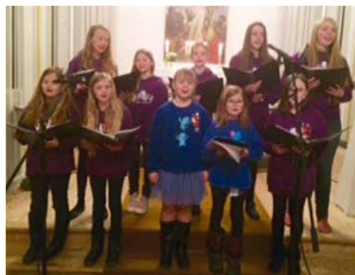
Jenter fra Vivace framførte "Aftenbønn for syngende barn".