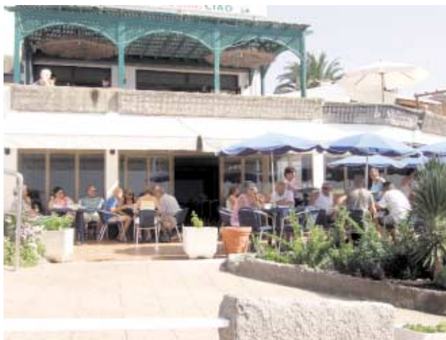
Her nytes det kaffe og vafler.