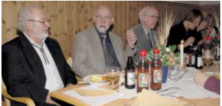
I gang Følsta