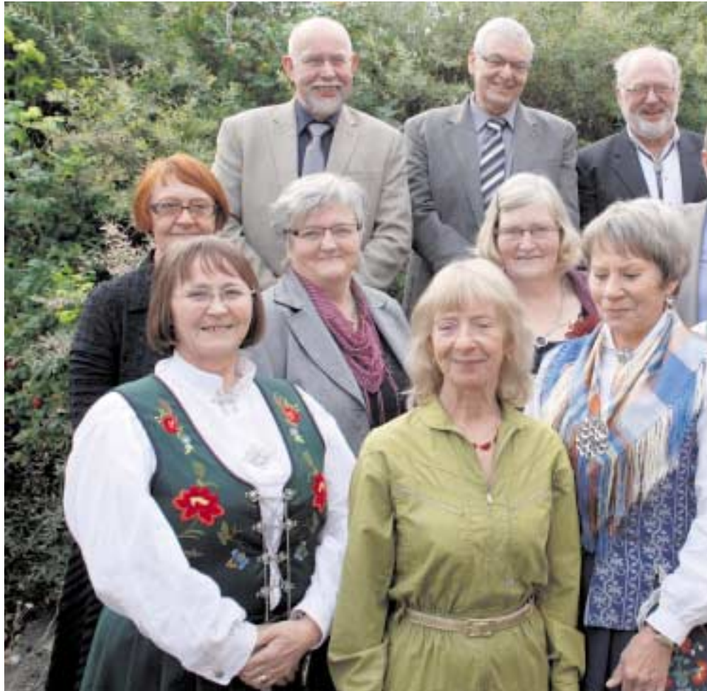
Mye å pr Fra v. Ak Jostein G Asbjørn