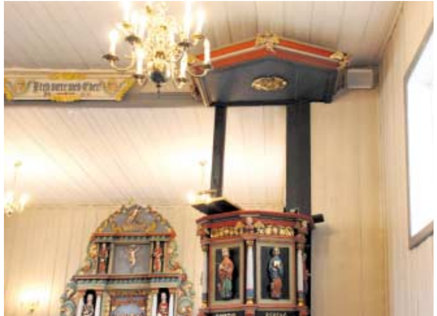
En av de nye høyttalerne i Salberg Kyrkje.